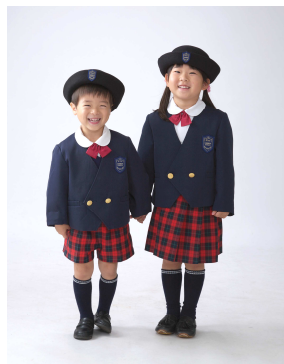
神村カラーの赤を取り入れた可愛いチェックの制服です!!