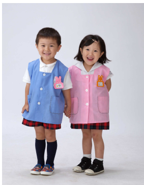
汚れても安心!夏の遊び着スタイル!!